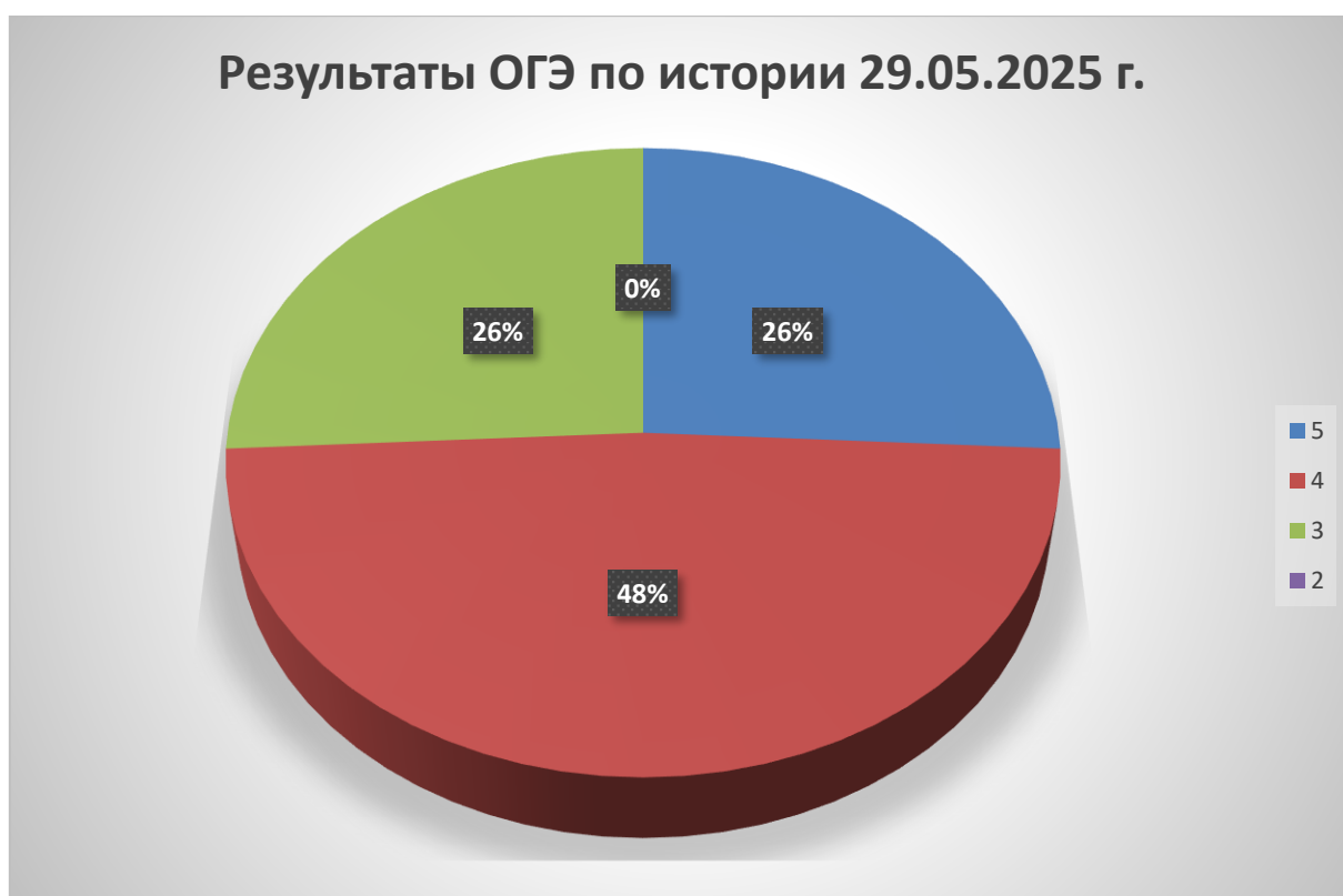
Диаграмма распределения оценок ОГЭ-2025 по истории

Освоили программу основного общего образования по истории и сдали в форме и по материалам ОГЭ успешно все выпускники (100%) ОО Белореченского района. Экзаменационную работу выполнили на: «5» -8 выпускников; на «4»-15; на «3» -8 человек; на «2» -0.