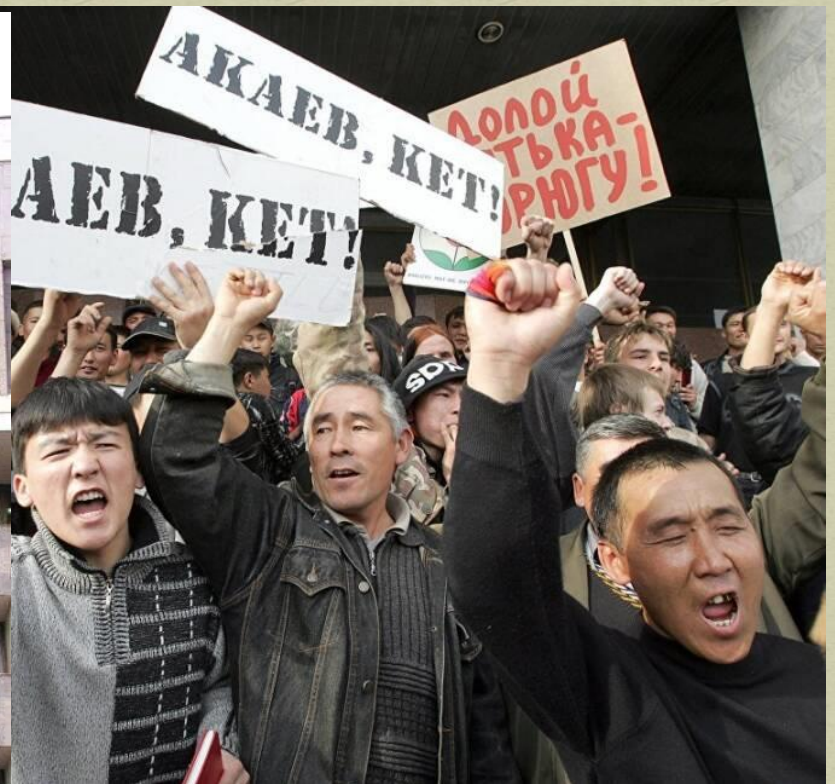
«Тюльпановая революция» в Киргизии (2004 год)