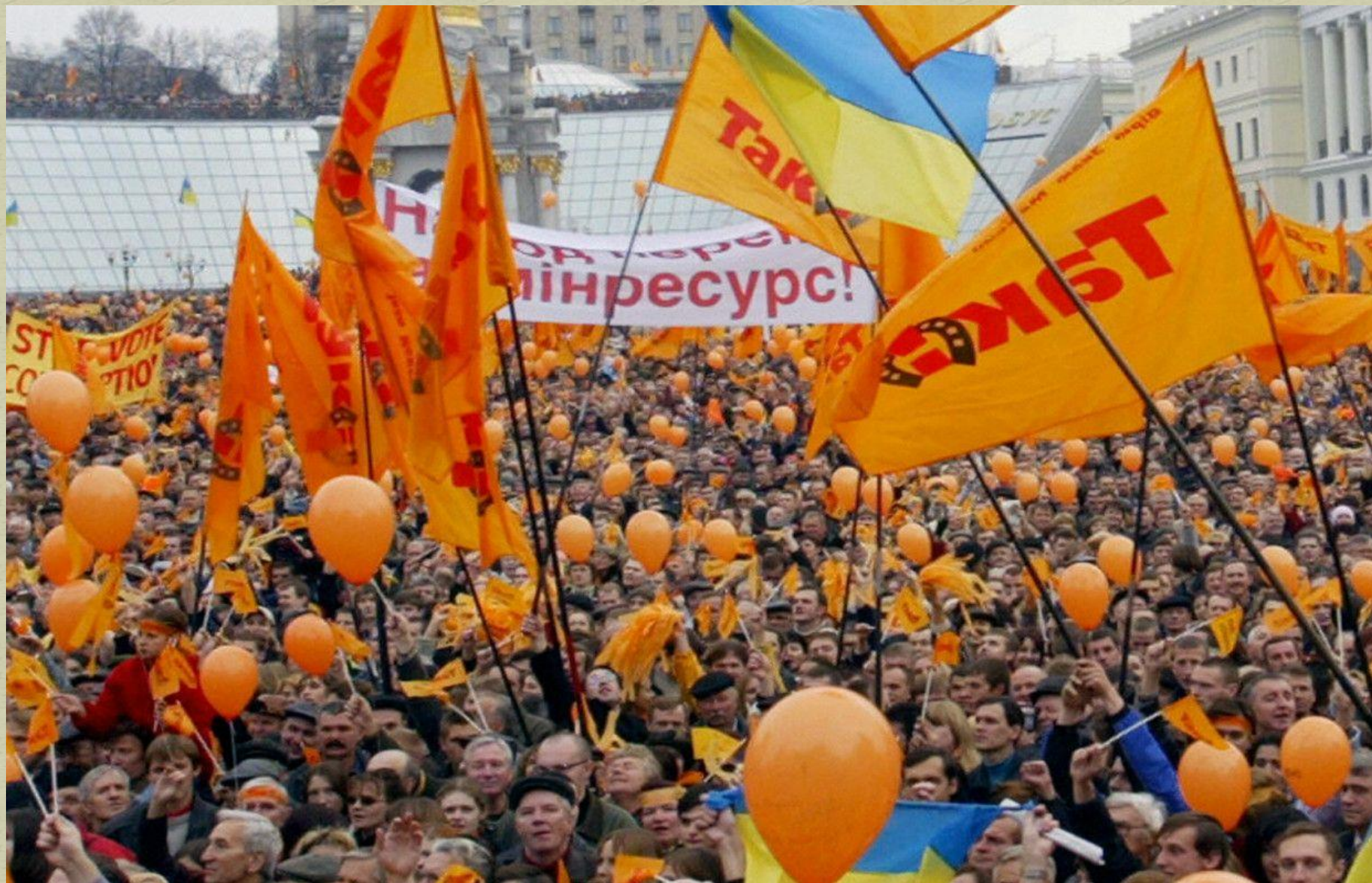
«Оранжевая революция» в Украине (2004 год)