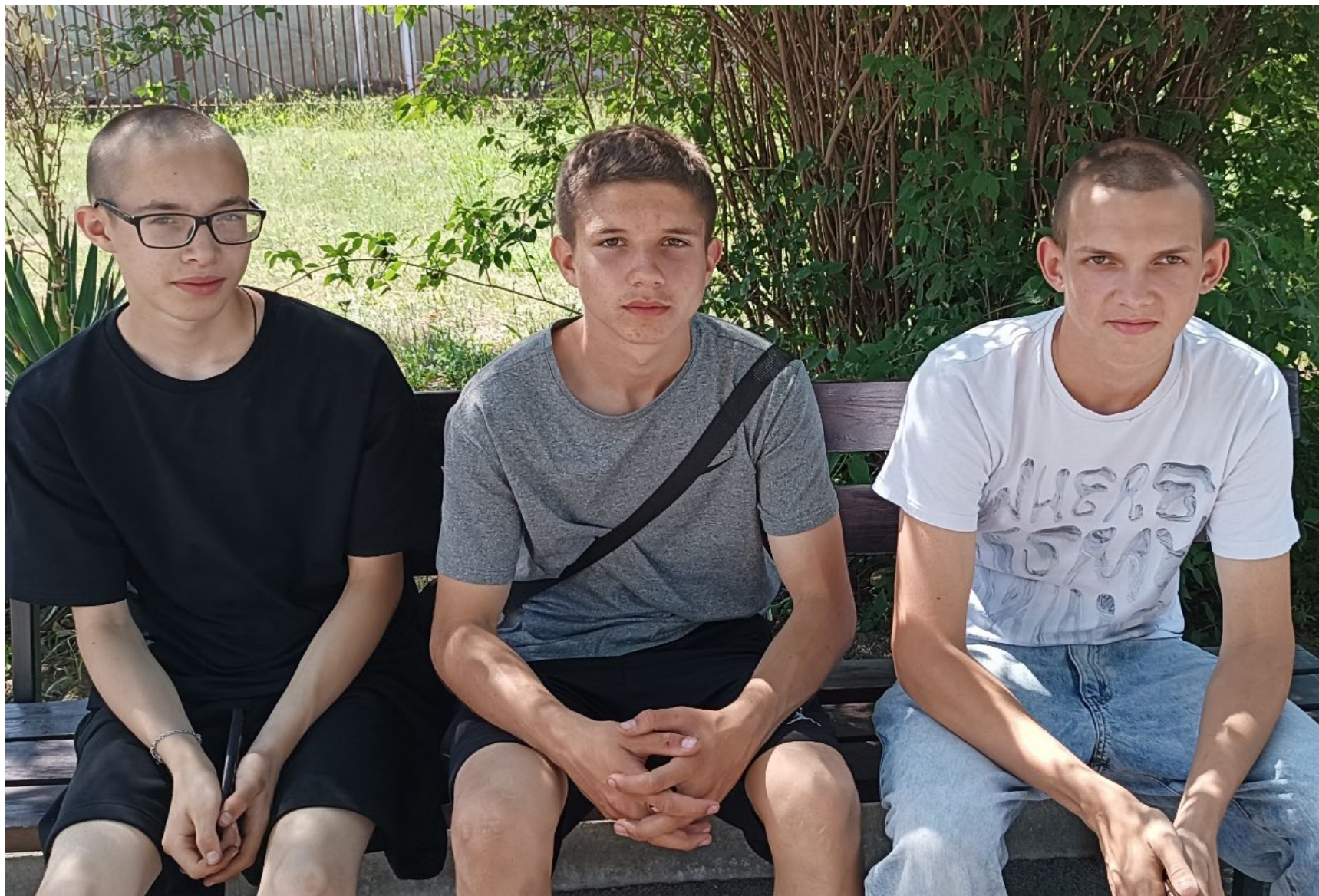
Участие в сопровождение младших школьников в мероприятиях района