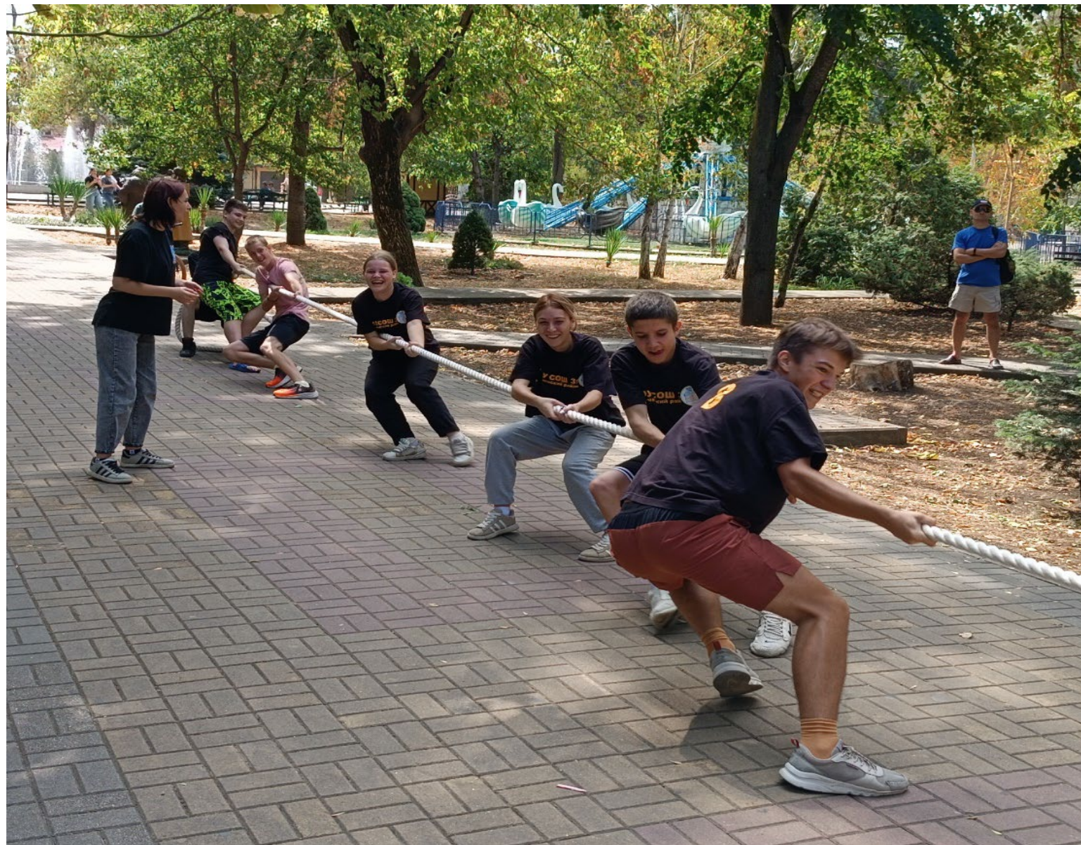
Участие в туристических и спортивных мероприятиях