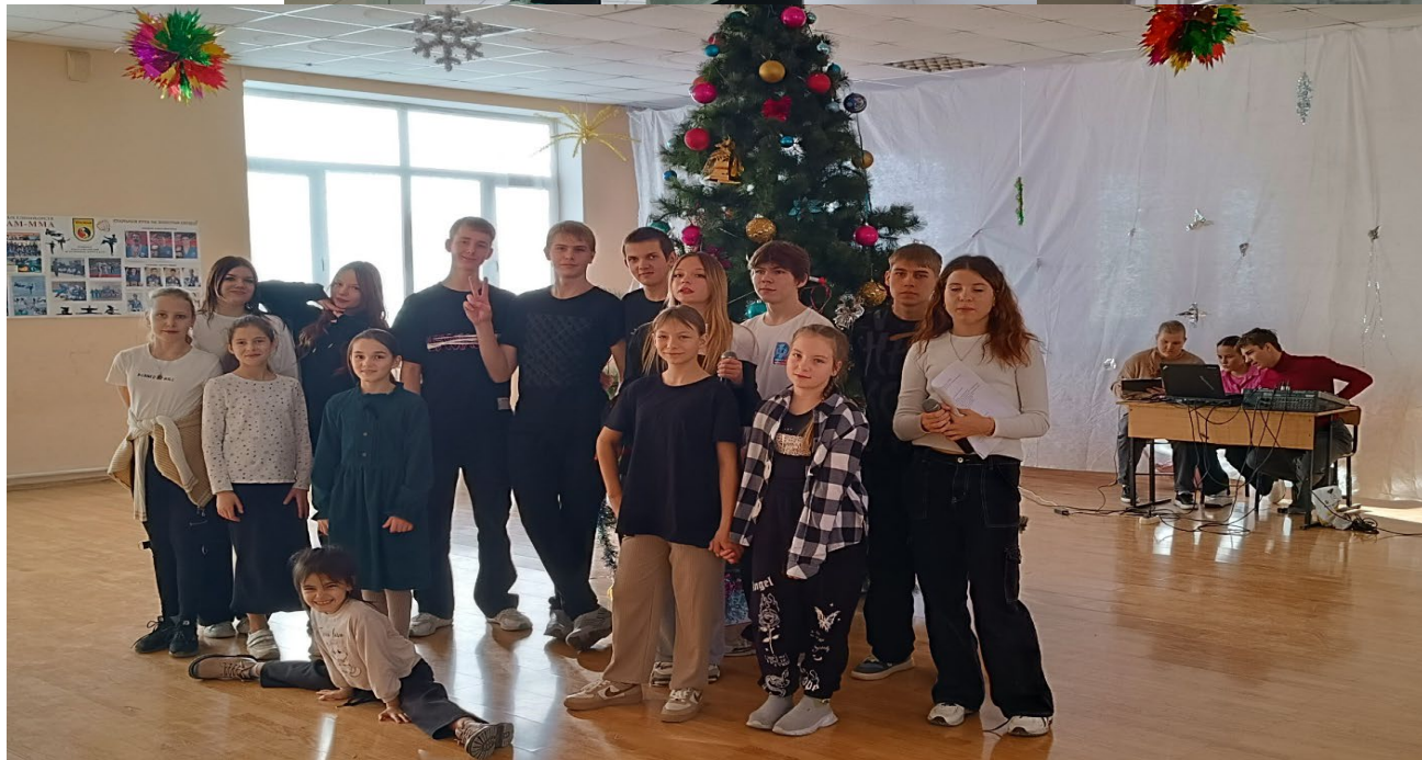
Мероприятие украшение школы